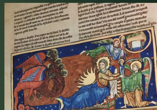
(トリニティ黙示録写本) 1230-50年代