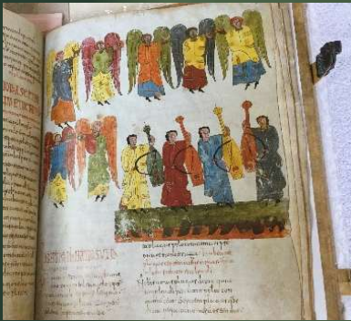
(マドリード写本) 10世紀末