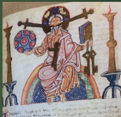
(新約聖書Bat. Lat. 29) 13世紀前半?