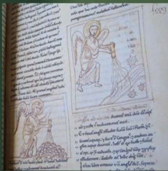
(ベルリン写本) 12世紀