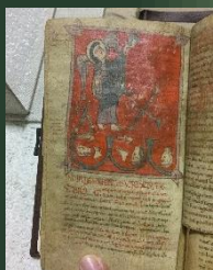
(コルシーニ写本) 縦170×横95