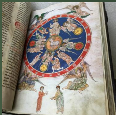
(マンチェスター写本) 縦454×横326