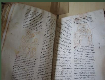
(ベルリン写本) 縦302×横190