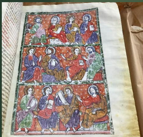
(ラスウェルガス写本) 縦520×横364