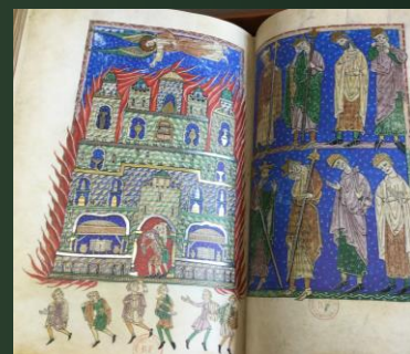
(アローヨ写本) 縦440×横305